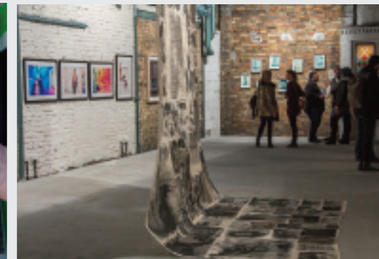
Impressionen vom Festival 2015.

Was gab für euch den Anstoß, in 2015 ein Festival für analoge Fotografie auf die Beine zu stellen und wie gestaltete sich die Umsetzung dieses Projekts?